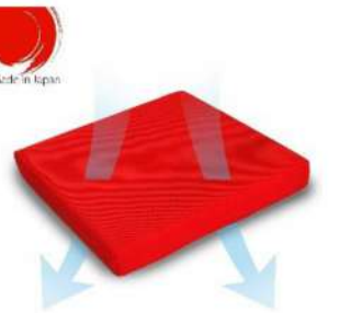
通気タイプ ブラック JAN 4582328928007